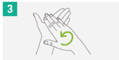
3 Frota las palmas de las manos entre sí