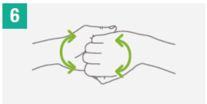
6 Frota el dorso de los dedos de una mano con la palma de la mano opuesta, agarrándose los dedos