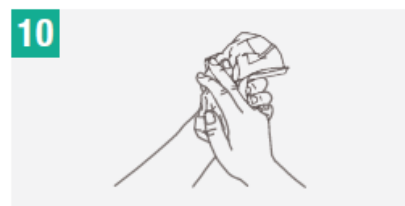
10 Secate con una toalla desechable