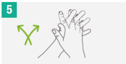
5 Frota las palmas de las manos entre sí, con los dedos entrelazados