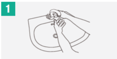
1 Mójate las manos con agua