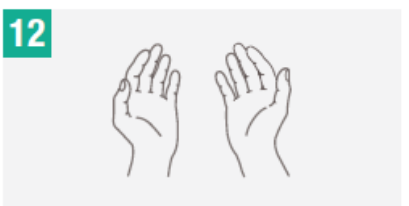
12 Tus manos son seguras