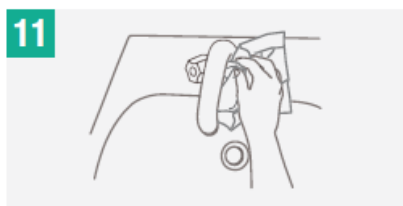
11 Utiliza la toalla para cerrar la llave